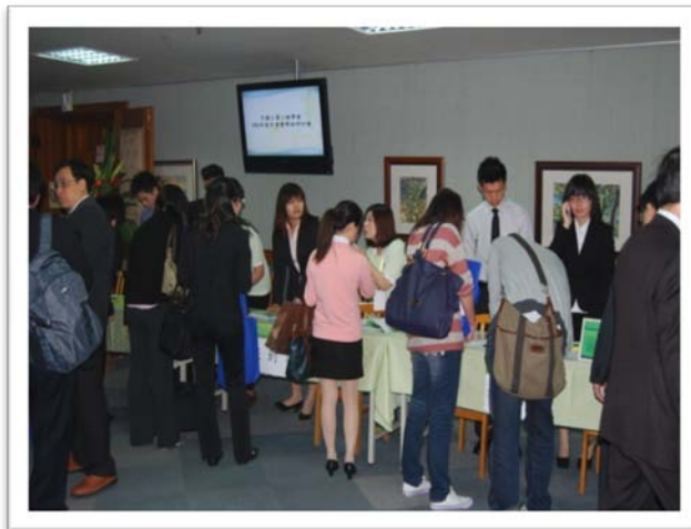
年會暨研討會現場報到實況 (二)