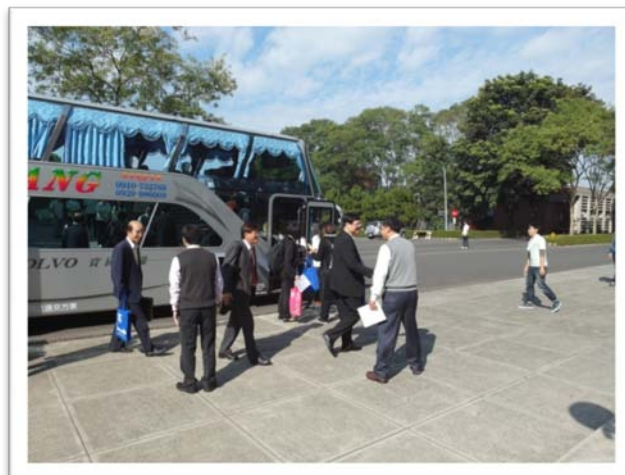
與會人員到場實況(一)