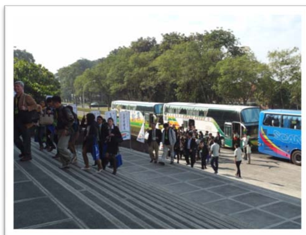
與會人員到場實況(二)