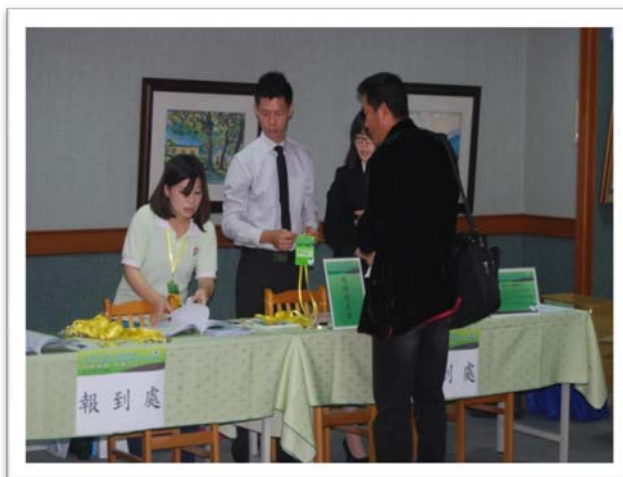
年會暨研討會現場報到實況 (三)