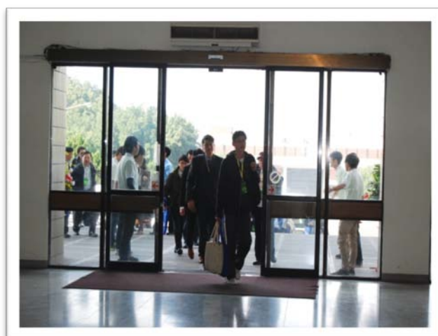
與會人員到場實況(三)