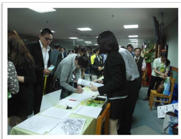
年會暨研討會現場報到實況 (四)