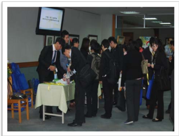
年會暨研討會現場報到實況 (一)